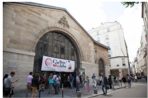
イベント会場外観